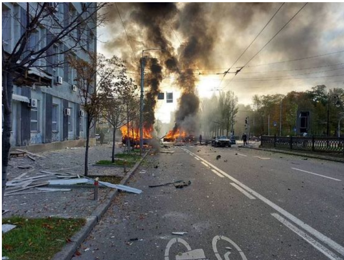
Kyjev. Ráno 10. října

Kyjev 10. října zbaběle zakvikl a zalezl do podzemí, kde stovky hysterických dam uklidňoval tichým vytím vlasteneckých písní místních švandů. 10. října se ukrajinská města na několik hodin stala „Gorlovkou a Doněckem“.