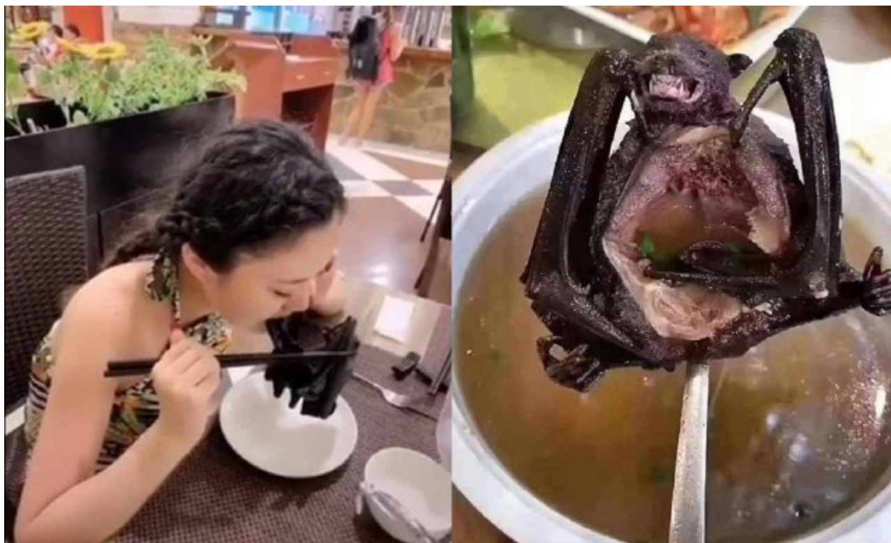
Pohádka, která všechno začala: Falešný netopýr v polévce

Televize Next News uveřejnila video, ze kterého běhá mráz po zádech.