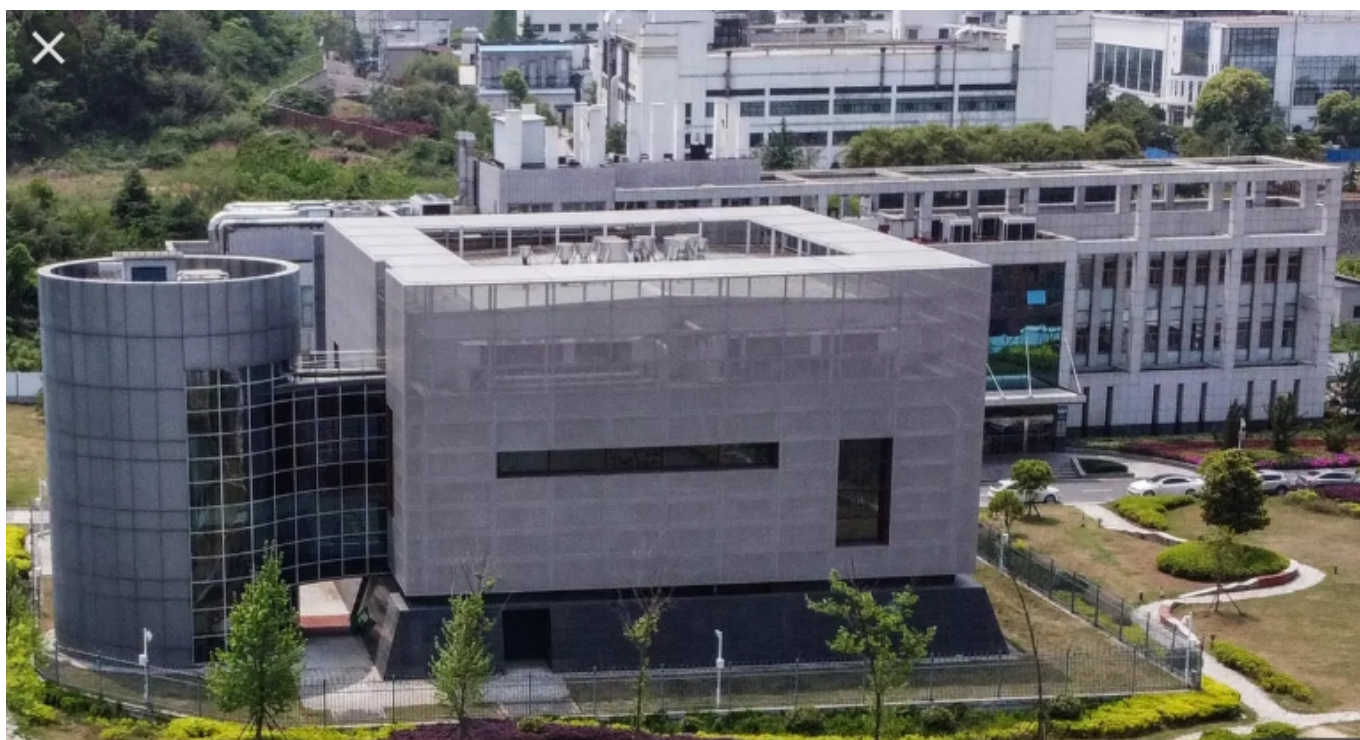
Laboratoř v čínském Wuhanu, kde probíhal výzkum, tajně financovaný Dr. Faucim

Prezident Trump nechává prošetřit i roli Světové zdravotnické organizace (WHO) v souvislosti s epidemií COVID-19. Prozatím je rozhodnut pozastavit WHO financování.