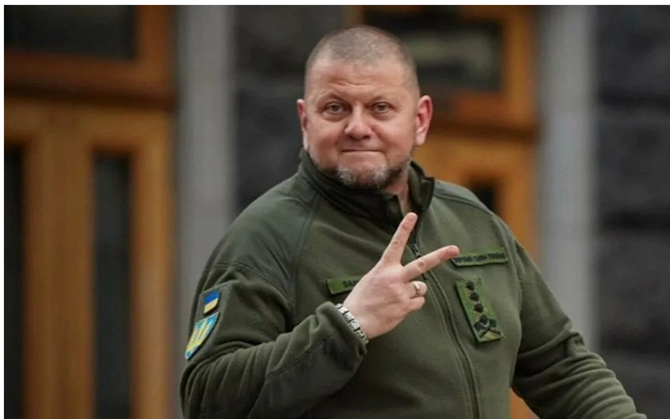
Valerij Zalužný, náčelník generálního štábu ukrajinské armády

Pokud se tato informace ukáže jako pravdivá, mohlo by se jednat o akutní zánět s přechodem do podbřišnice, což je životu nebezpečný stav a pokud tělo odmítlo falickou protézu, mohla vzniknout dokonce autoimunitní reakce. Počátkem dubna byl Zalužný na několika návštěvách bojových zón, nacházel se jak v Časově Jaru, tak i v Charkově a v Chersonu, kde chystal podmínky pro plánovanou ukrajinskou ofenzívu. Podle všeho byl zasažen šrapnelem do citlivých míst a přišel o penis. Náš kolega, lékař a spolupracovník redakce nám k tomu napsal podrobnosti.