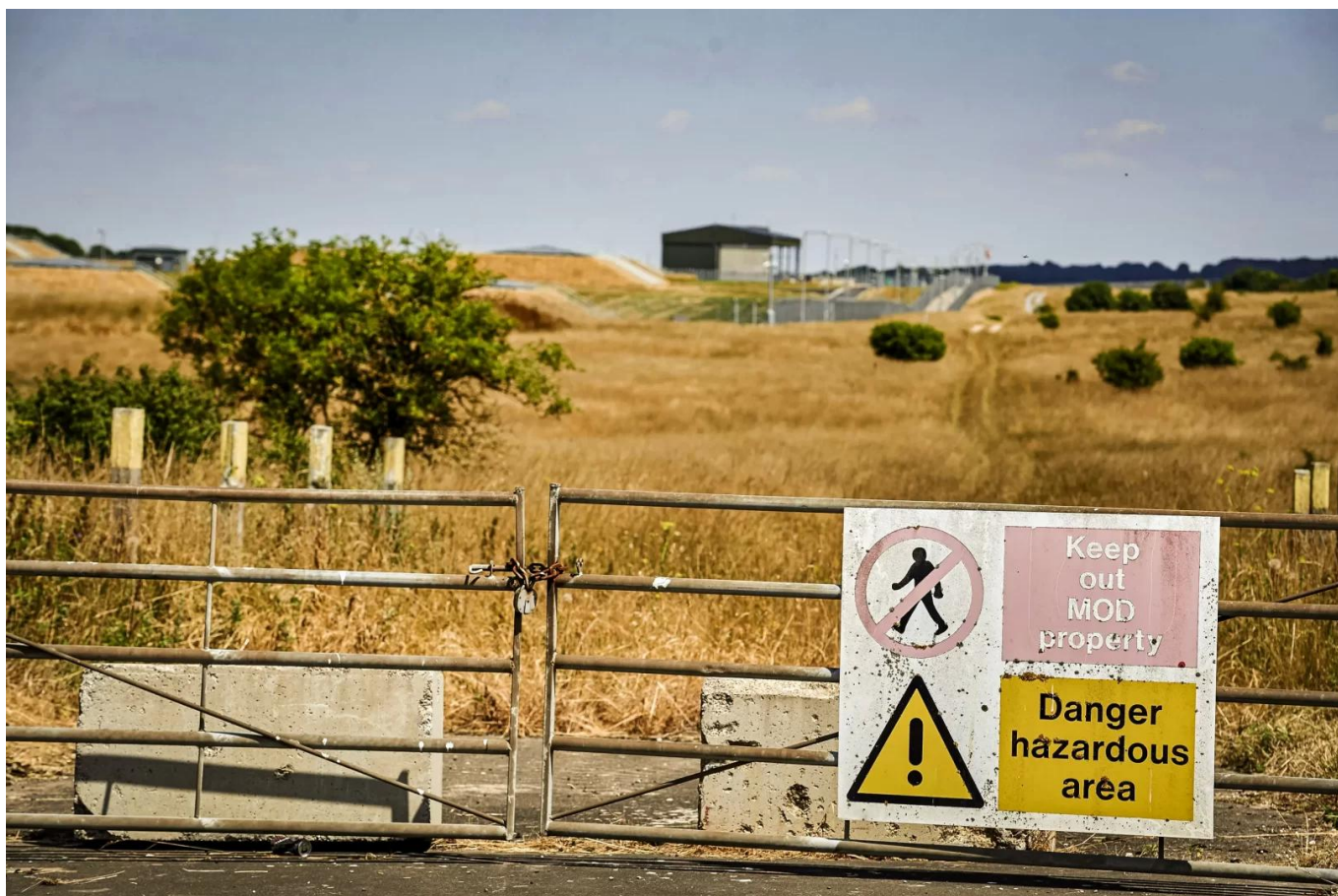
Porton Down, vědecký park, v němž sídlí laboratoř ministerstva obrany, je na snímku ve vesnici Porton nedaleko Salisbury ve Spojeném království 8. července 2018.

Kromě vývoje vakcín proti hrozbám, jako je například virus ptačí chřipky H5N1, bude Centrum pro vývoj a hodnocení vakcín pracovat také na léčivých přípravcích proti horečce Lassa, viru Nipah a krymsko-konžské hemoragické horečce, což je virus přenášený klíšťaty. Mnohé z těchto nemocí jsou na seznamu patogenů WHO, které by mohly v budoucnu způsobit pandemii.