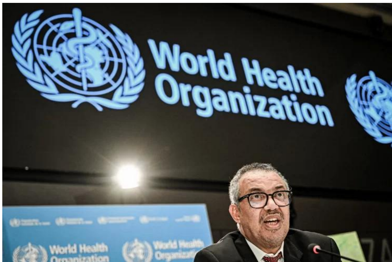
Šéf Světové zdravotnické organizace Tedros Adhanom Ghebreyesus na tiskové konferenci v Ženevě 6. dubna 2023.