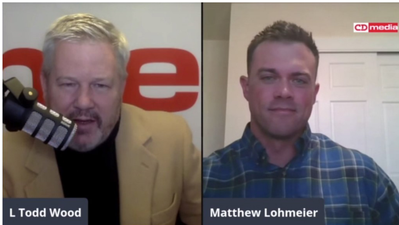
Matthew Lohmeier (vpravo) během natáčení podcastu

„Toto rozhodnutí bylo učiněno na základě veřejných komentářů, které podplukovník Lohmeier pronesl v nedávném podcastu. Generálporučík Whiting zahájil velením řízené vyšetřování (CDI), zda tyto komentáře nepředstavovaly zakázanou stranickou politickou činnost,“ uvádí se v prohlášení.