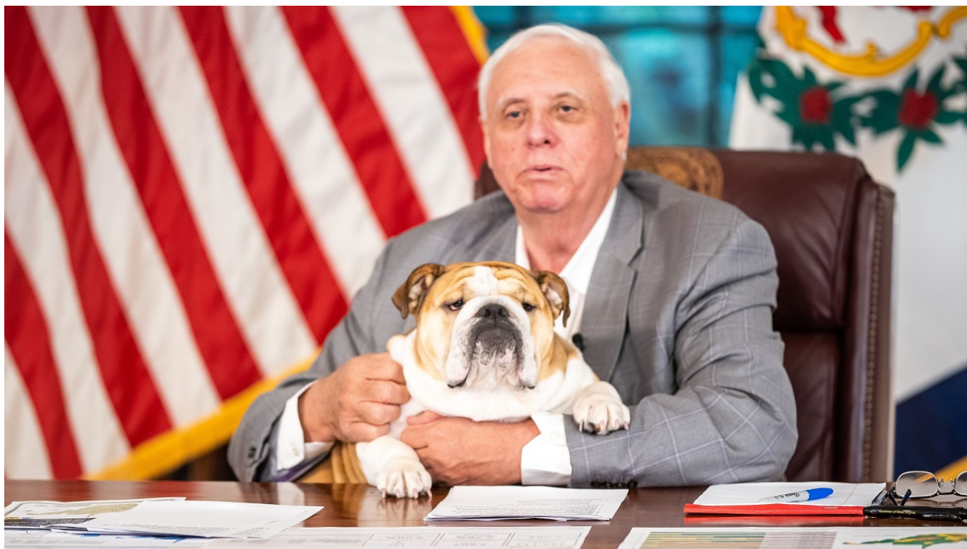
Obr. Guvernér Jim Justice (D) oznamuje štátnu vakcinačnú tombolu

Zoznam štátov a incentív je zverejnený TU . Z neho vyberám ešte ďalšie. V štáte Delaware každý zaočkovaný môže vyhrať 300 tis. USD a dva ŠPZky. Podobne už 12-roční v Massachusetts môžu vyhrať túto sumu celkom 5-krát na štipendium, dospelí 5-krát milión. Štát Guam má tombolu so 6 autami. Hawai ponúka rôzne dovolenkové balíčky, jedným z nich je aj výlet do Las Vegas. Rollercoaster kolotočový park je jedna z cien v mnohých štátoch. New York dáva permanentky na metro zadarmo, New Jersey pivo.