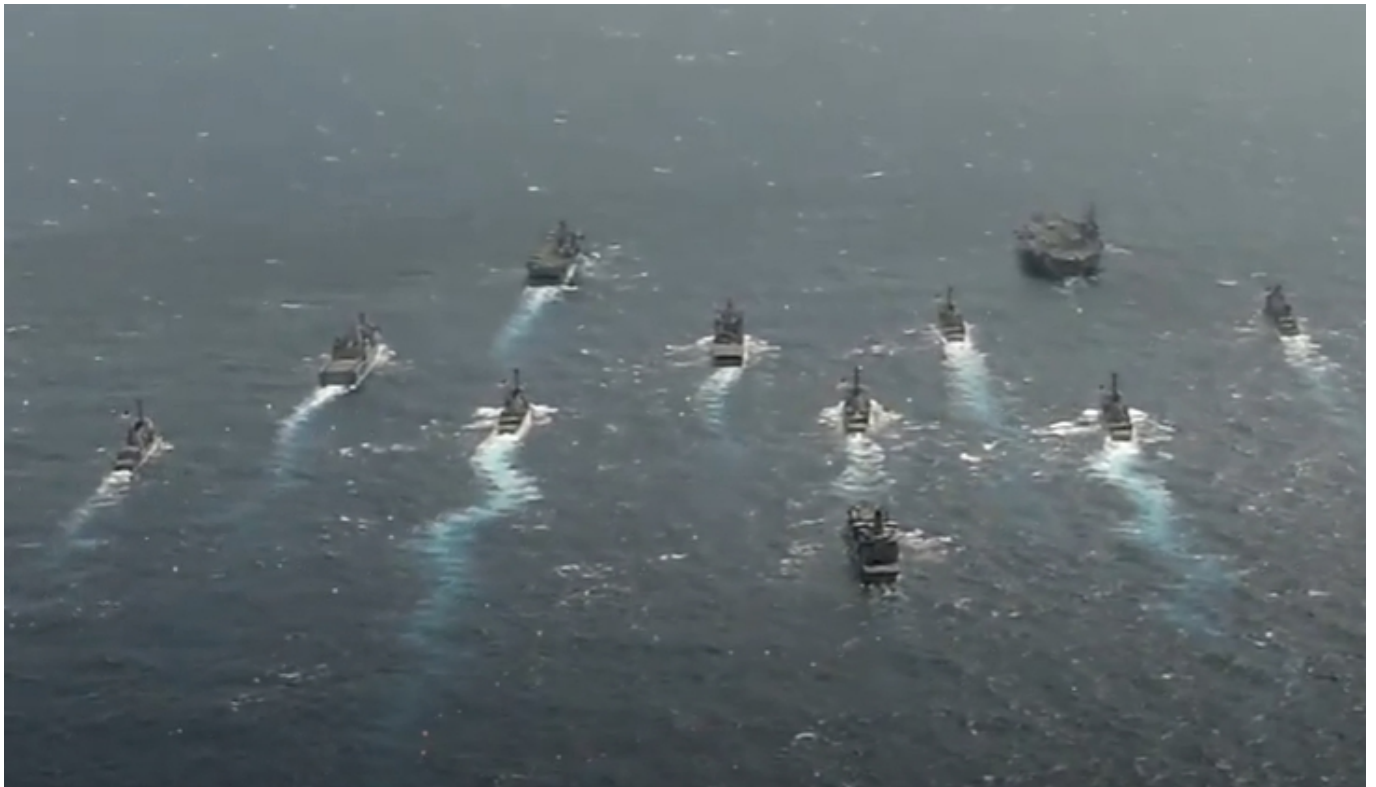
Americké lodě v jihočínském moři

Obě třecí plochy jsou přímo spojeni s geopolitikou moci a globální strategií obou supervelmocí.