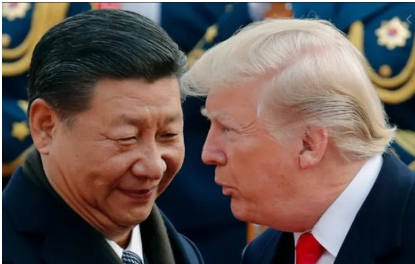
Prezident Číny Si a prezident USA Donald Trump