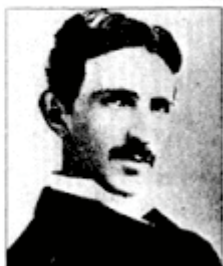
Nikola Tesla: Is his research helping the Soviet Union build the ultimate weapon?

If someone were attempting to implement Tesla's plans for broadcasting energy by "creating resonances inside the earth's ionospheric cavity" calculated in Colorado Springs during 1899 experiments by the electrical genius.