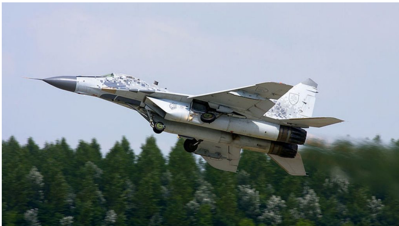
MiG-29 v době, kdy ještě patřil Slovensku

Ukrajinci prý tak moc spěchají s ofenzívou, že nebyl ani čas na vyjednání transportu stíhaček po slovenské železnici, protože to trvá nějakou dobu, než se zasmluvní přepravní podvalníky (ešelony) a Ukrajinci tolik času na ofenzívu nemají. Takže si přijeli na Slovensko přímo s tahači ukrajinské armády a celé se to provedlo za hluboké noci. Američané musí být opravdu moc spokojeni s Hegerovou vládou v demisi. Servis na jedničku, bohužel na úkor 5 milionů občanů Slovenska, se kterými si Hegerova vláda vytírá hvězdami a pruhy malované pozadí a ještě se jim šklebí a nadává jim do opic a paviánů. V Česku to jsou pro změnu proruští švábové. Inu, každý národ má nějaké zvířátko.