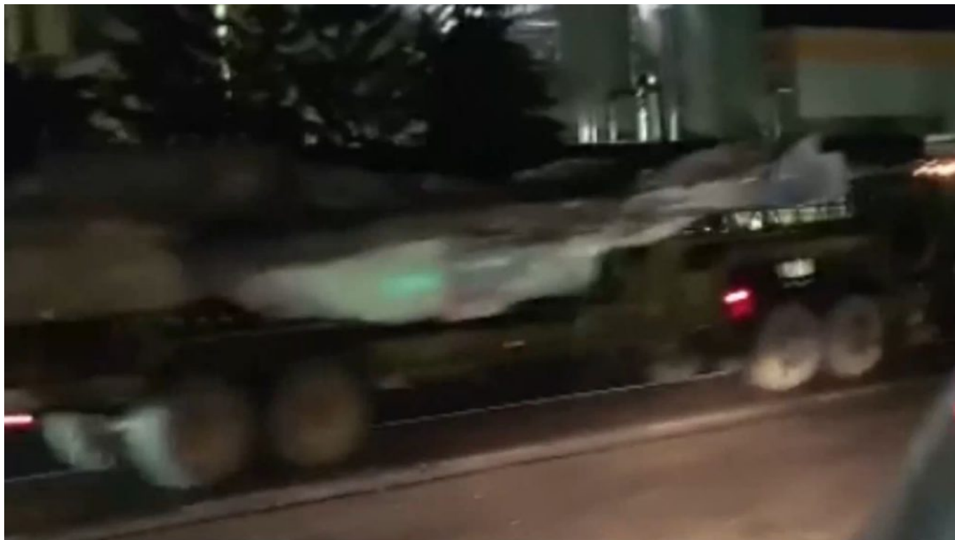
Trup MiG-29 na návěsu tahače KrAZ

Ukrajinci žádné neletuschopné stíhačky nemohou dostat, protože je nemají kde opravit. Jediná opravna stíhaček MiG a Suchoj se nacházela v Kyjevě a 3. března 2022 byla masivním bombardováním zcela zničena. Pokud jsou nějaké stroje pro Ukrajinu neletuschopné, budou před dodávkou na Ukrajinu opraveny. Taková je dohoda mezi vládou SR a Ukrajinou, ve stejném znění byla podepsána i mezivládní dohoda.