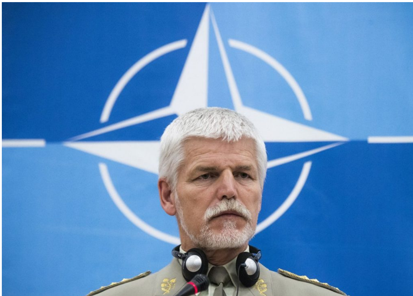
Generálprezident Petr Pavel

v USA budou příští rok prezidentské volby, které se vždy nesou v duchu protiválečné kampaně. Do podzimu prostě Ukrajina musí dokázat nemožné, jinak bude konec.