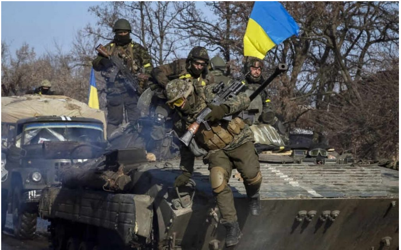
Ukrajinská armáda (AFU)

je nejlepší na světě. Co dokáží Rusové s artilérií, z toho se doslova tají dech. Takže Ukrajinci teď potřebují zbraně, děla, tanky a stíhačky, a samozřejmě letuschopné, na nějaké opravy nelétajícího šrotu nemají Ukrajinci ani čas, ani kapacity a ani trpělivost.