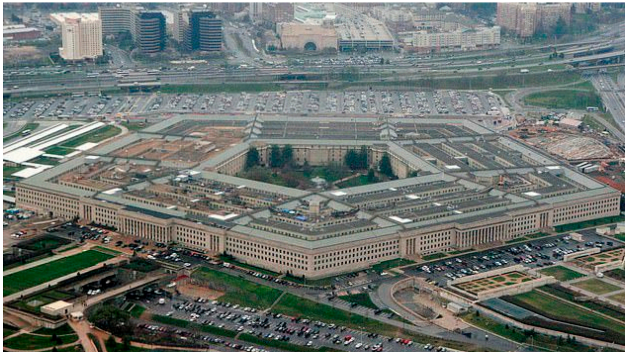
Pentagon čekají velké výzvy

Prezident Trump a mnozí odborníci poukazují na to, že údajná epidemie je mediální fikce, protože nevrostl absolutní počet zemřelých. 99 % údajných obětí koronaviru navíc zemřely na jinou nemoc, například rakovinu.