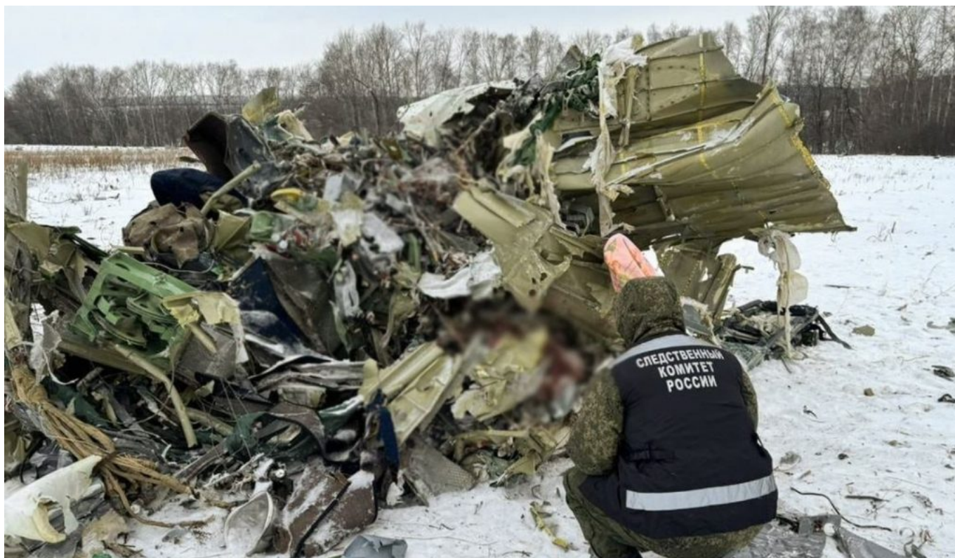
Lidská těla vlisovaná do trosk letadla IL-76

V ruských médiích se spekuluje, že tento sestřel má vyvolat protesty na Ukrajině a destabilizovat už tak vratkou Zelenského vládu. Ruské ministerstvo obrany totiž uveřejnilo letový manifest se jmény ukrajinských zajatců a ruští novináři již na něm identifikovali 12 jmen elitních bojovníků pluku Azov, zbytek byli běžní vojáci AFU. Kdokoliv rozhodl o sestřelu letounu se zajatci, chtěl na Ukrajině vyvolat nepokoje.