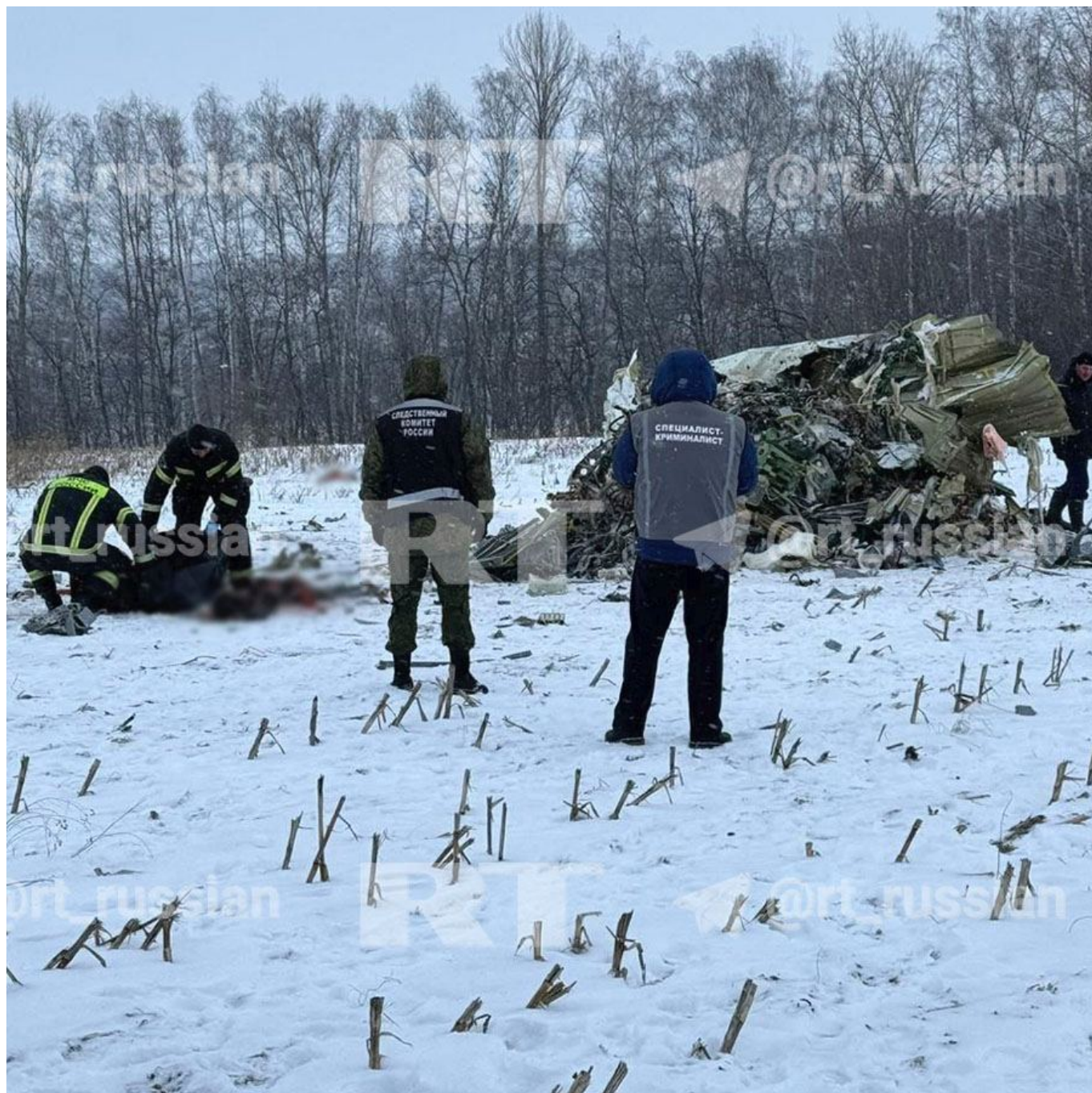
Sběr lidských těl z trosk letadla IL-76

Podle novinářů jde o snahu jedné části ukrajinské armády destabilizovat v Kyjevě režim Zelenského, protože teď se začnou Azováci mstít některým velitelům v ukrajinské armádě. Daleko závažnější je však samotný fakt, že je to vůbec poprvé, kdy byl americký SAM Patriot, určený Američany čistě k defenzivě a obraně druhého největšího ukrajinského města Charkov, použit k útočné operaci hluboko nad ruským územím.