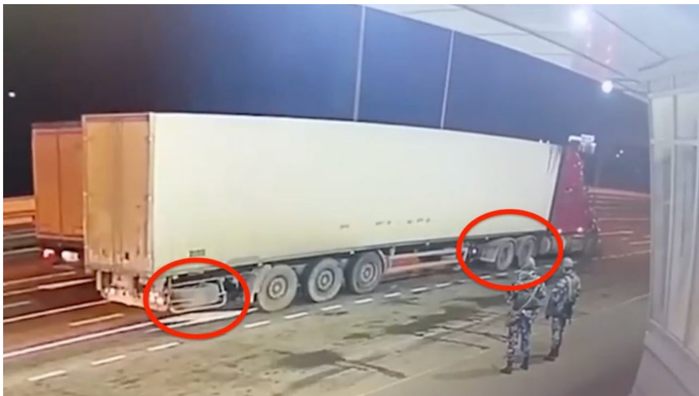
Americký kamion na strážnici u vjezdu na Krymský most

Některé anglické výrazy mají polský přízvuk, některé britský akcent a některé typický americký přízvuk. Proto Kuleba při odpovědi založil ruce křížem a odpověděl, že za útoky stojí Ukrajina, ale v podvědomí ví, že to není úplně ze 100% pravda, protože za mnoha útoky je de facto NATO. Tyto mimovolní projevy jsou naprosto spolehlivým indikátorem. Kulebovo založení rukou je bohužel překryto českými titulky, ale originál videa bez titulků můžete vidět zde .