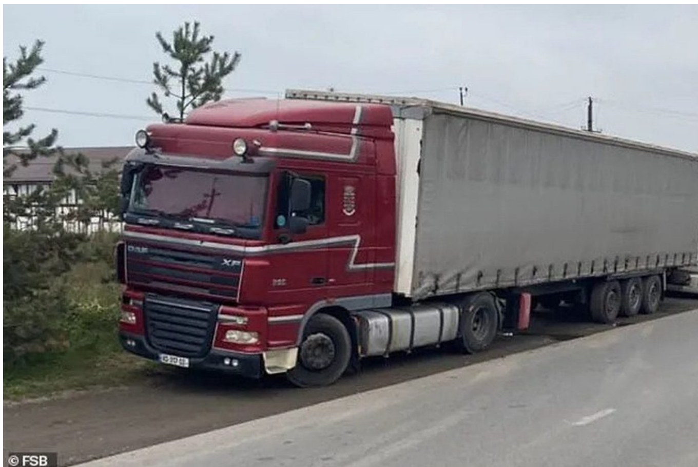
Tento kamion DAF přivezl do skladu v Rusku náklad s výbušninami z Gruzie

Vovan a Lexus ale nahrávku z nějakého důvodu publikovali až dnes 13. října, prakticky s měsíčním zpožděním. Na co a proč s publikováním čekali tak dlouho? Chápete? No, není přece nic krásnějšího, než když tvrdíte, že za výbuchem na Krymském mostě stojí Ukrajinci, a potom za pár dnů vyjde video, ve kterém se ministr zahraničí Kuleba jako truhlík a největší trumbello chvástá tím, že když někde něco vyletí na Krymu do povětří, tak v soukromém rozhovoru, jenom mezi námi, pane velvyslanče, se k tomu můžeme přiznat, ano, jsme to my, Ukrajinci! Chápete? Kdyby tupost kvetla, Kuleba by byl obsypaný květy jako jablůň na jaře.