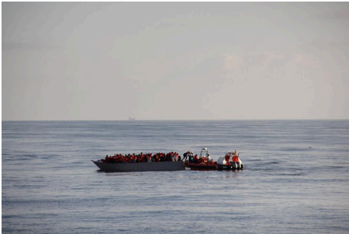
úlovek lodi Geo Barents Lékařů bez hranic