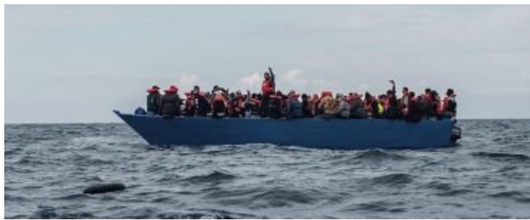
Klienti lodi Sea Eye 4 patřící německé neziskovce