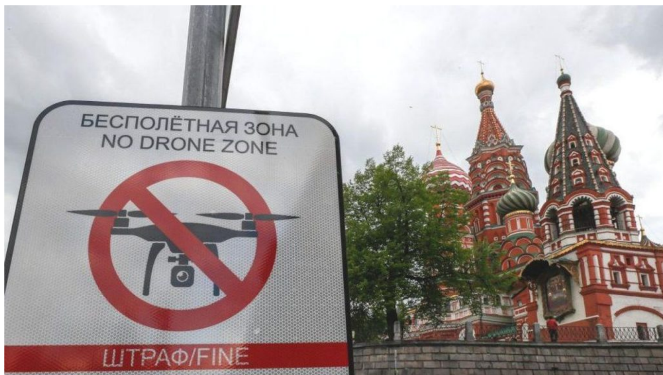
Cedule se zákazem provozu dronů v blízkosti Kremle

V Rusku se už na sociálních sítích od rána řeší, jak je možné, že dron doletěl až nad Kreml? Doletěl by až k Putinovi do ložnice bez povšimnutí PVO? Ten podle informací v té době v Kremlu vůbec nebyl, nacházel se v pracovní rezidenci na okraji Moskvy, ale představte si situaci, že by dron nesl špinavou jadernou bombu, prostě konvenční bombu naplněnou radioaktivním materiálem a izotopy těžkých kovů. Celý Kreml by musel být evakuován na mnoho let, a to kvůli radiaci, podle velikosti nálože by došlo k zamoření celého okolí, centra Moskvy. To by vyvolalo paniku a nepokoje. Začal by narůstat odpor proti Vladimíru Putinovi, že není schopen ochránit už ani Moskvany před ukrajinskými útoky.