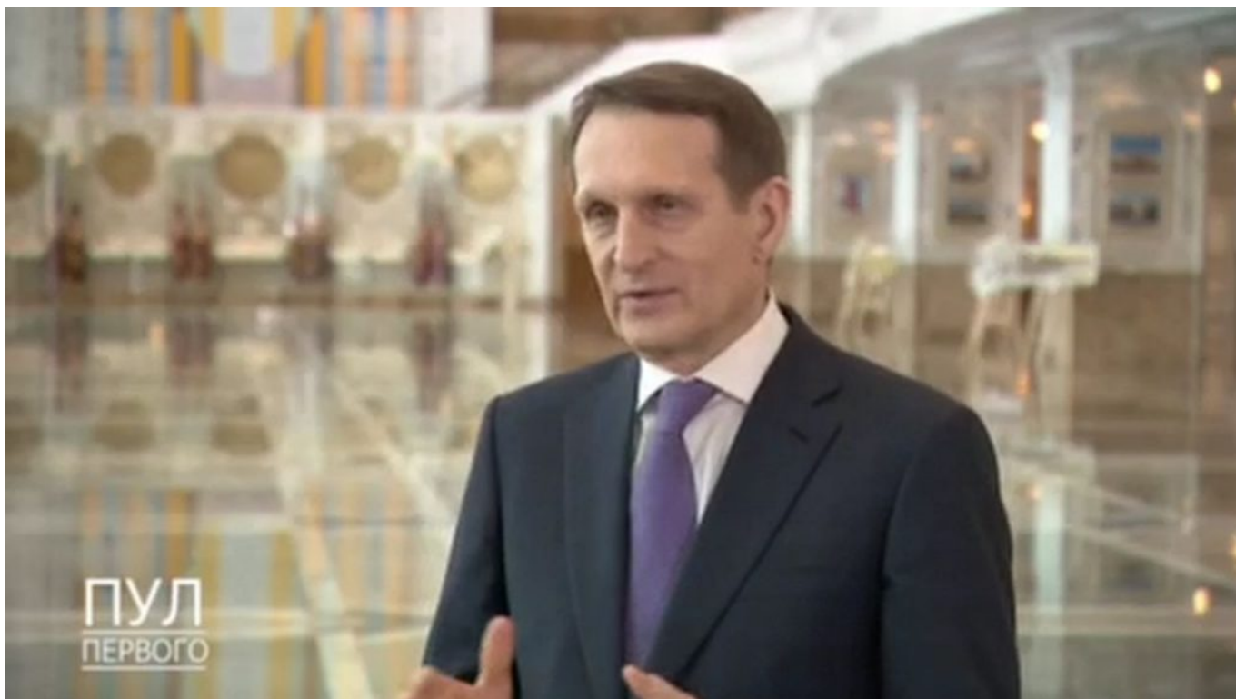
Sergej Naryškin, ředitel ruského zahraničního zpravodajství (SVR)

nerealizovalo. Naopak, Čína se začala sblížovat s Ruskem v plánu na odchod od amerického dolaru. A proti tomu nedokáže nic zmoci ani deset ukrajinských ofenzív, ani sebevíce západních tanků a stíhaček dodaných Kyjevu, protože to je proces, který proxy válkou na Ukrajině nejde zastavit. Jinými slovy, Ukrajina splnila svoji úlohu pouze tím, že zatáhla Rusko do války na svém území, v čemž vydatně pomáhaly západní vlády. Jenže to je maximum, co bylo možné realizovat s pomocí Ukrajiny.