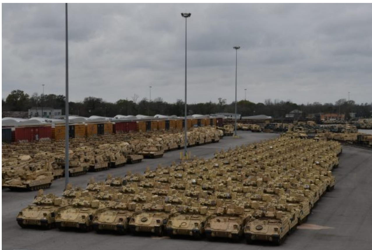
Americké tanky pro Evropu