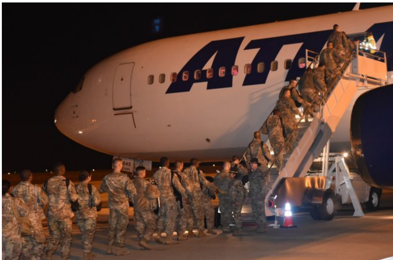
Vojáci USA jdou do Evropy