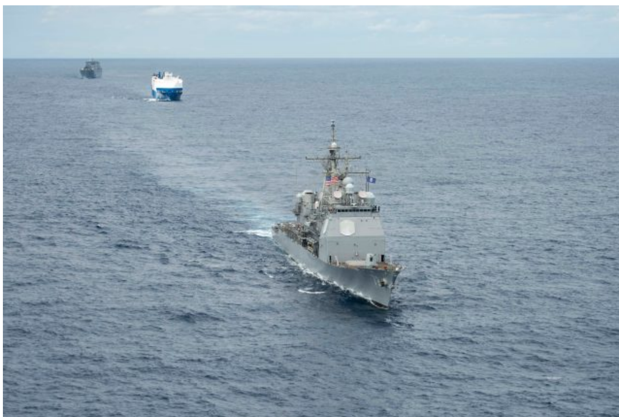
Americké lodě převážejí techniku