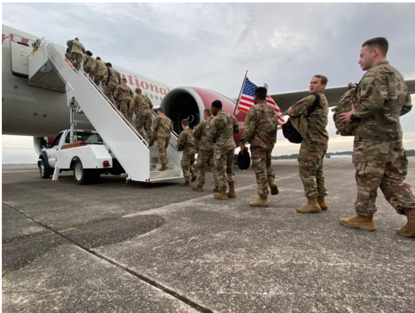
20 tisíc vojáků USA míří do Evropy

V Polsku buduje USA novou obří základnu když její vojáci opouští nespolehlivé Německo. Při té příležitosti prodali Polákům zbraně za miliardy dolarů, ostatně jako všem evropským zemím včetně České republiky (vrtulníky za 40 miliard korun).